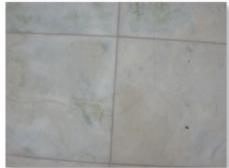
Afb. 1 Scheurvorming in een tegel waarvan het materiaal aangetast werd door vorst-dooicycli.

Bij de zoektocht naar de oorzaak van scheurvorming in terrastegels uit natuursteen dient men tevens na te gaan of het materiaal voldoende